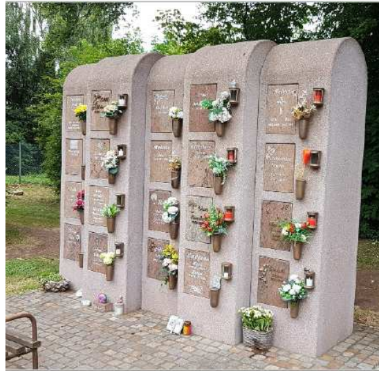
Urnenwahlgrabstätte in der Stele

werden auf allen städt. Friedhöfen angeboten. Urnenwahlgrabstätten in der Stele sind Grabstätten für die oberirdische Urnenbestattung. Die Stele ist mit Urneneinzelkammern für je zwei Urnen ausgestattet.