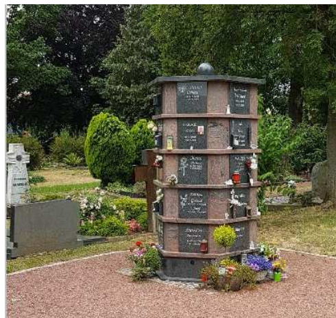
Urnenwahlgrabstätte in der Stele